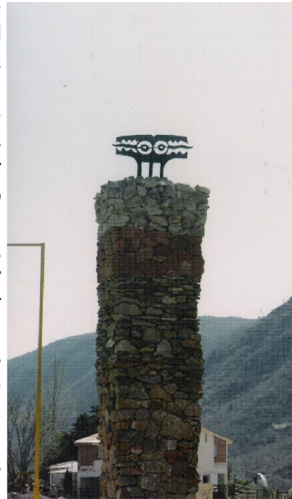
Totem ubicado en la localidad «El Rodeo»

En la actualidad las universidades se mueven en el marco de un nuevo modelo científico cuya base lleva a extender la noción de racionalidad científica a la noción de «comunidad de pares extendida», para una estrategia efectiva de resolución de los problemas ambientales en conjunto con la comunidad. Las dificultades que surgen para decidir acciones y proponer normas de sustentabilidad están entrelazadas por procesos de elecciones políticas. Es necesario repensar las políticas desde la localidad del saber, arraigado en un territorio y una cultura, desde la riqueza de su heterogeneidad, diversidad y singularidad; y desde allí intentar configurar escenarios futuros a través del diálogo intercultural de saberes y la hibridación de los conocimientos científicos con los saberes locales. El objetivo de esta presentación es mostrar la labor de un proyecto de extensión vinculado con el establecimiento de Sistema de Areas Forestales Protegidas (SAFP) en el Partido de Luján, Provincia de Buenos Aires. La metodología del