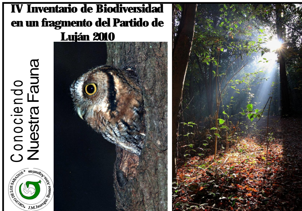
Tapa del futuro fascículo a publicarse el próximo año

Ante las diversas situaciones complejas ambientales que se presentan en nuestro planeta, la noción de Patrimonio Natural-Cultural se va estableciendo como una prioridad mundial, ya que la misma involucra a los ecosistemas del pasado y del presente, y dentro de este último, la biodiversidad y los bosques, con todas las potencialidades de vida que ellos presentan. Para conocer la riqueza de los mismos es fundamental realizar inventarios cualitativos y cuantitativos que permitan conocerlos y utilizarlos sustentablemente.