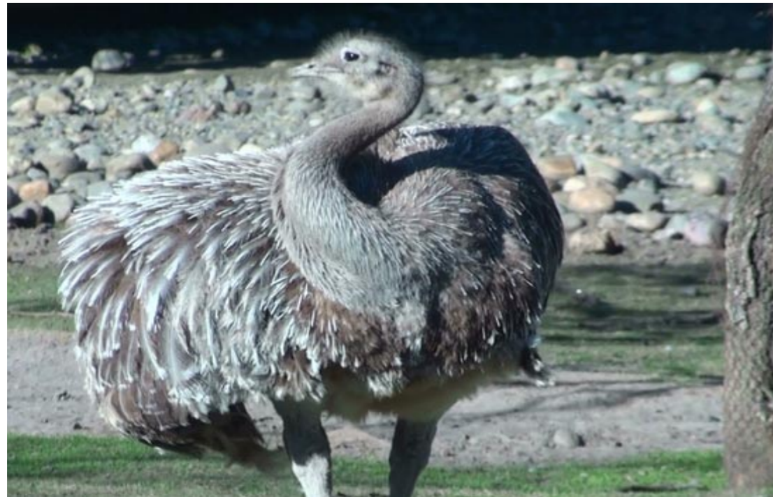
Foto de un Choique donde se observan el ápice blanco en las plumas de las alas.

Ellos reconocerán en este trabajo, el corto estudio que hicimos de la hermosa familia ñanduésica y nos es lisonjero esperar que valorarán una parte, aunque mínima, del que emprendimos sobre el genio y hábitos de nuestros apreciados compatriotas de la campaña».