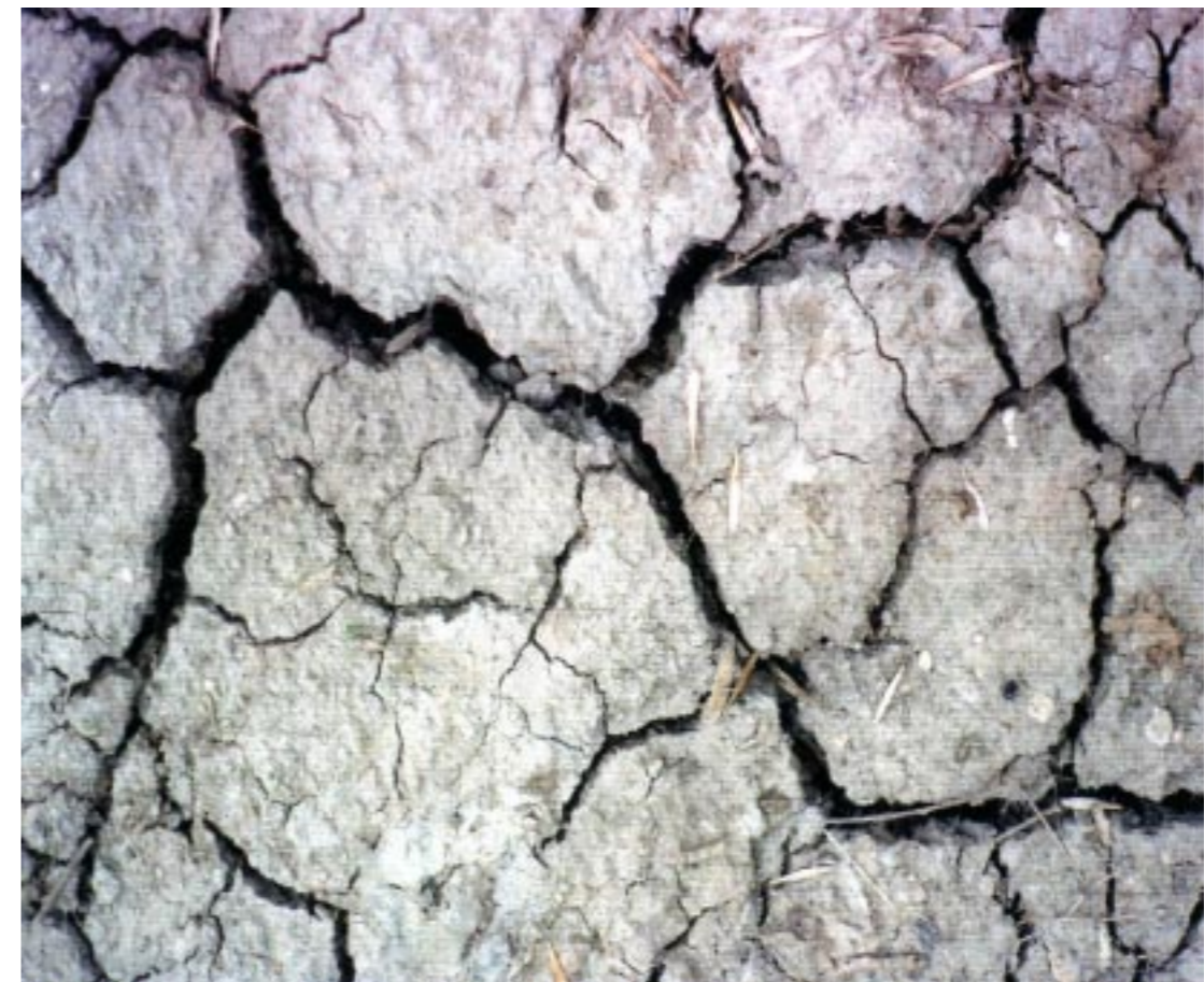
Base del lecho del arroyo El Chaña, en el campo educativo Lasallano "El Mirador", en el verano de 2008 que muestra la fisura del suelo dada la ausencia de precipitaciones.