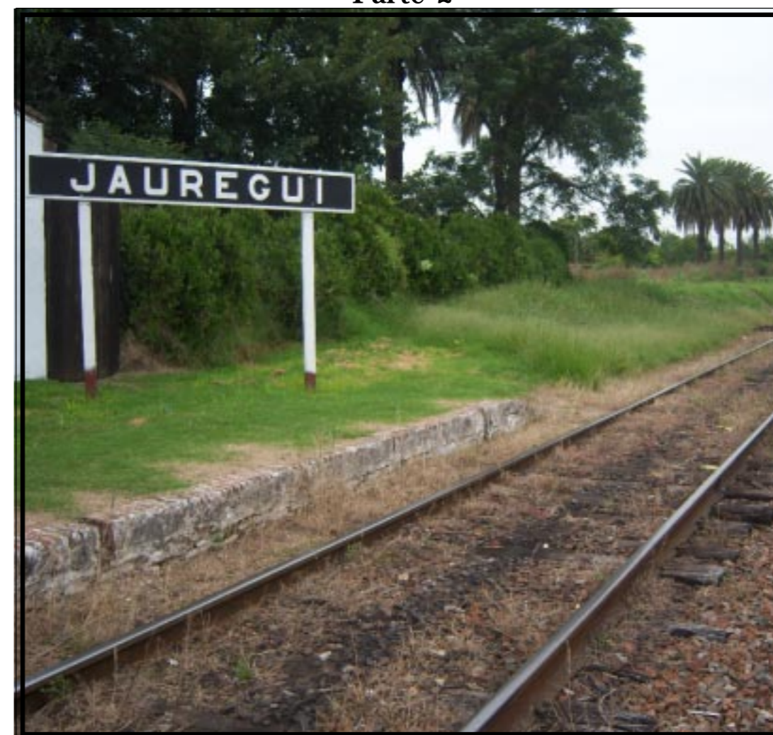
Cartel identificador de la estación, el único en buen estado