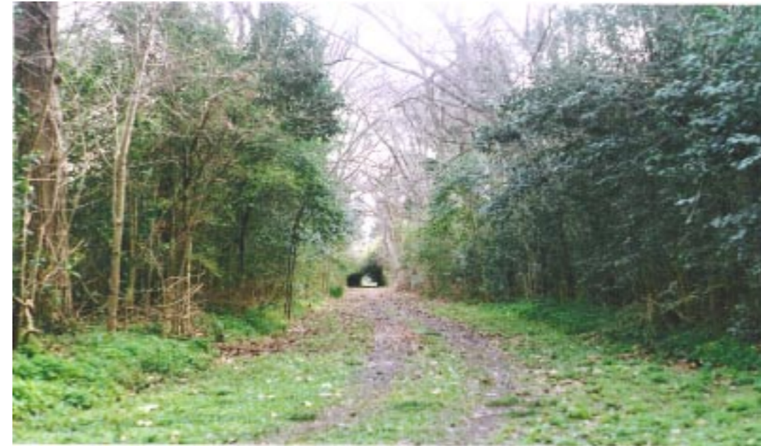
Fotografía del bosque ribereño en el Parque Industrial Algoselan Flandria

Sobre la importancia de los árboles comentan «...no sólo proporciona placeres inocentes, sino durables y que cada año renacen. Nada ciertamente puede dar tantas satisfacciones como la vista y el goce de paseos deliciosos a la sombra de los árboles que uno ha plantado con sus manos, ellos están prontos para nuestro recreo y para darnos crecidas utilidades con toda la seguridad que es posible en el orden de la naturaleza».